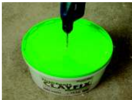
Loch in Deckel bohren, bei geschlossenem Eimer trocken durchmischen