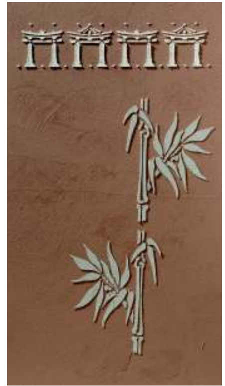
Japan PAGODEN, BAMBUS GROB