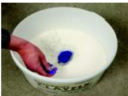
Pigmentbeigabe trocken in eine Kuhle