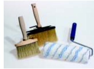
Werkzeuge: ovale Streichbürste, Quast, Lammfellrolle