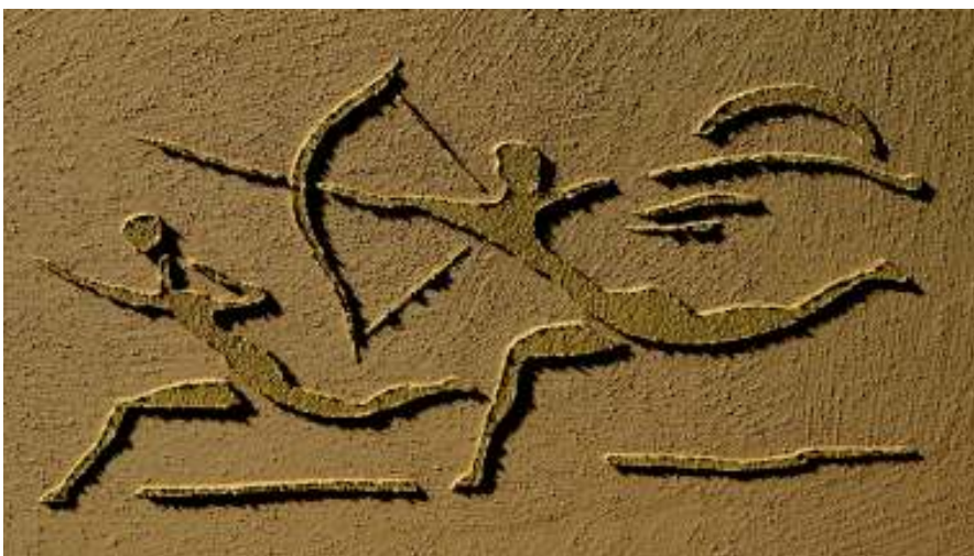
Afrika JAGDSZENE AUSSCHNITT