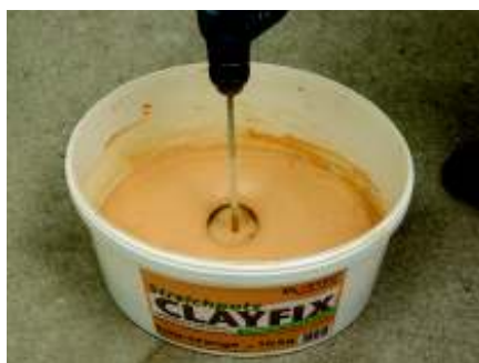
Nach 30 Minuten Quellzeit gut durchrühren