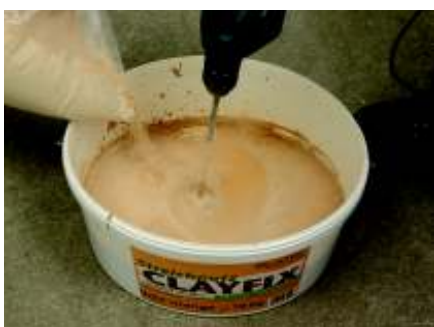
Einrühren des Eimerinhalts in Wasser

Alle Farben können untereinander gemischt werden. Anhaltspunkte für mögliche Farb-abstufungen gibt die Mischfarbenübersicht für Lehmputze auf Seite 6 und Pigmentbeimischungen auf Seite 7. Pigmentzugaben sind bis 6 % möglich.