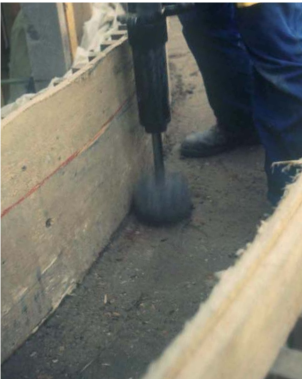
Abb. 1.1.1: Stampfen mit dem pneumatischen Stampfer, hier Nachstampfen der Randbereiche.