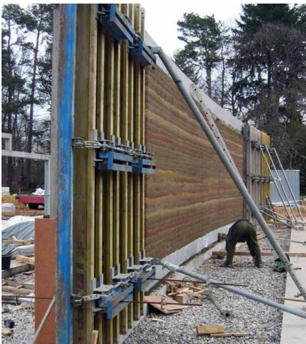
Abb. 1.1.1: Vor-Ort-Ausführung einer Stampflehmwand mit stabiler Schalung